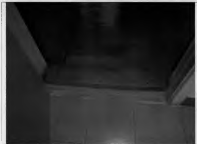
Фото №13 – Внутренние двери