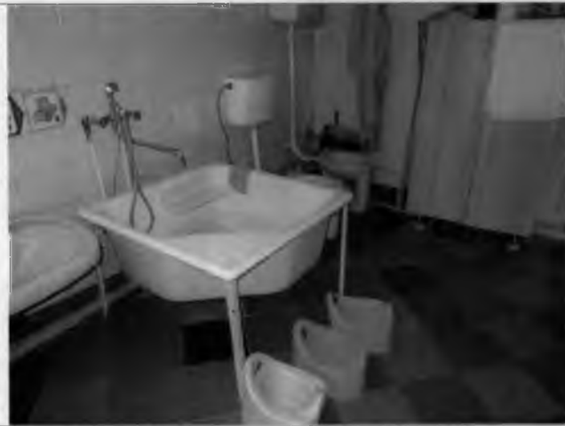
Фото №27 – Санитарно-гигиенические помещения