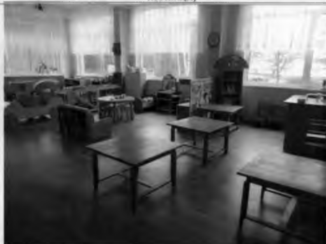
Фото №22 – Зона целевого назначения здания (Зальная форма обслуживания)