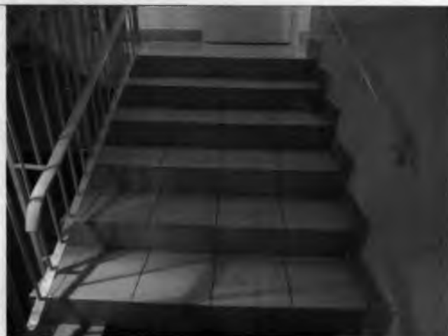
Фото №20 – Путь (пути) движения внутри здания (внутренние лестницы)