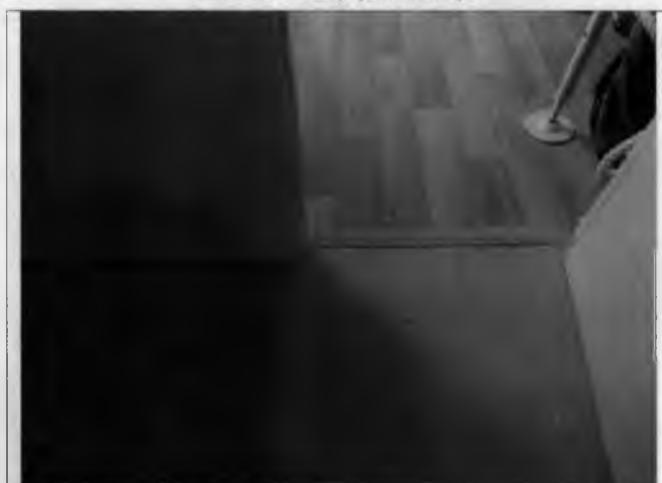
Фото №15 – Внутренние двери