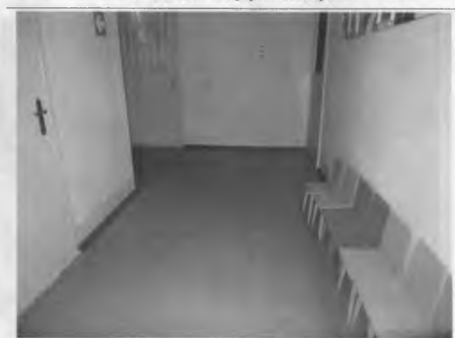
Фото №18 – Путь (пути) движения внутри здания (коридоры)