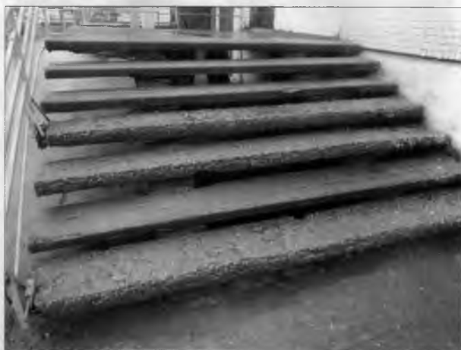
Фото №9 — Отдельный вход в группу расположенную на первом этаже. Наружная лестница