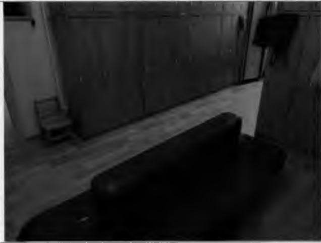
Фото №25 – Гардероб