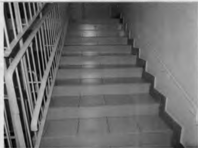
Фото №19 – Путь (пути) движения внутри здания (внутренние лестницы)