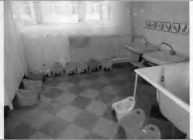
Фото №26 – Санитарно-гигиенические помещения