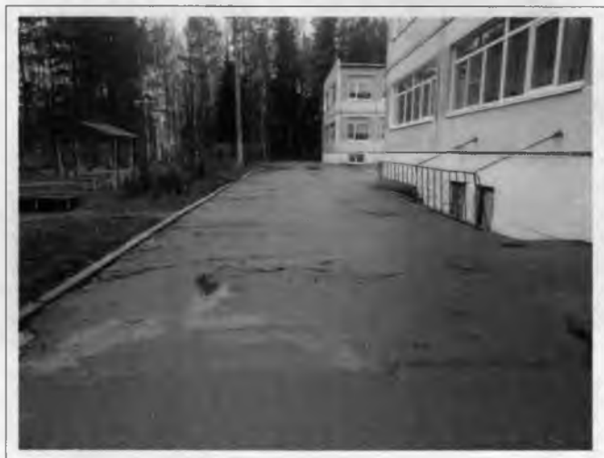
Фото №3 – Прилегающая территория