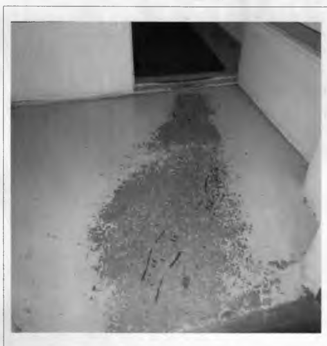
Фото №6 – Тамбур