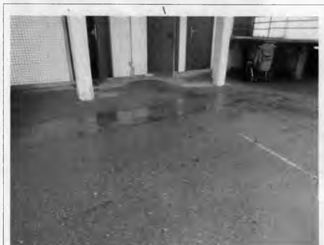
Фото №4 – Главный вход