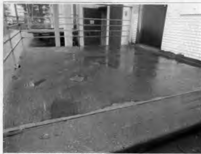
Фото №10 – Отдельный вход в группу расположенную на первом этаже. Входная площадка.