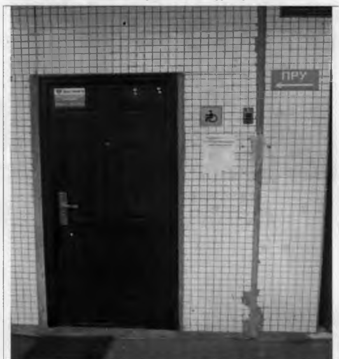
Фото №5 – Наружная входная дверь