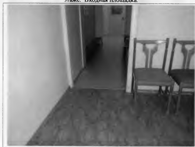
Фото №12 – Внутренние двери