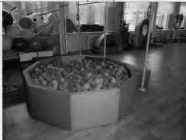
Фото №24 – Зона целевого назначения здания (Зальная форма обслуживания)