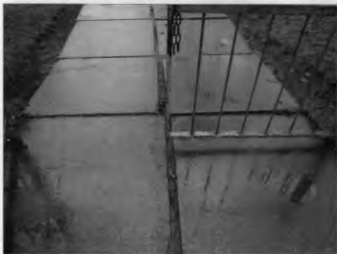
Фото №1 – Вход на прилегающую территорию