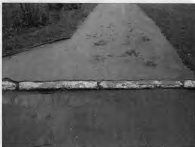
Фото №2 – Прилегающая территория