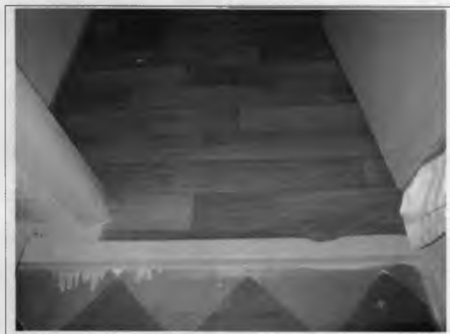
Фото №14 – Внутренние двери