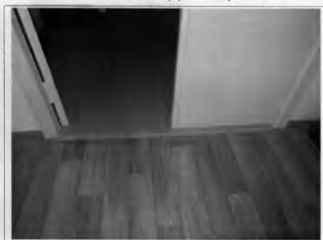
Фото №16 – Внутренние двери