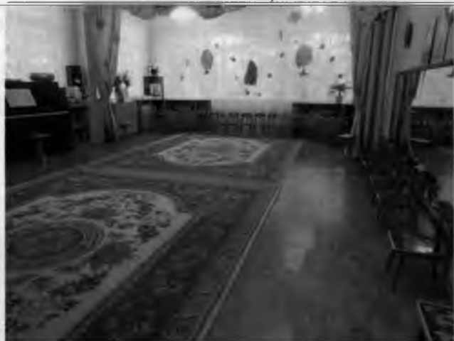
Фото №21 – Зона целевого назначения здания (Зальная форма обслуживания)