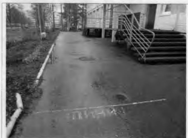
Фото №8 - Отдельные входы в группы расположенные на первом этаже