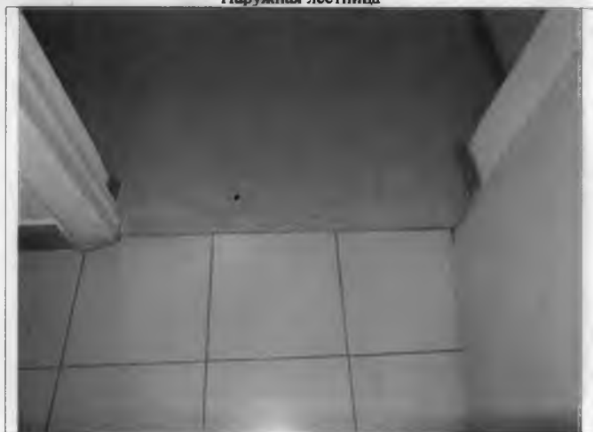
Фото №11 – Внутренние двери