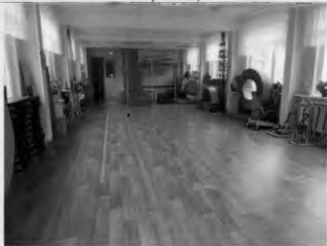
Фото №23 – Зона целевого назначения здания (Зальная форма обслуживания)