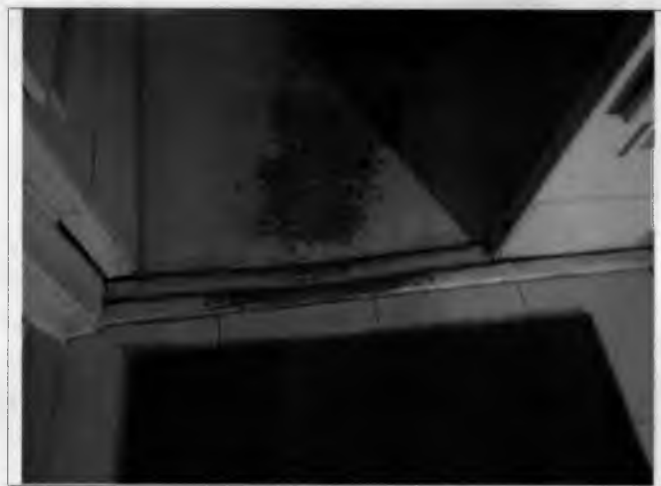
Фото №7 – Внутренняя входная дверь